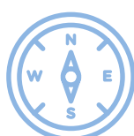
Pages Pulse Éthique et Conformité