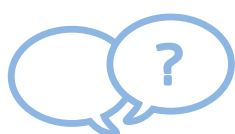
Obtenir des directives

Nous encourageons cependant quiconque ayant signalé un problème à indiquer ses coordonnées. Cela permettra un traitement plus rapide et précis des problèmes signalés. Tous les signalements sont traités en toute confidentialité, indépendamment des considérations d'anonymat ou du mode de signalement.