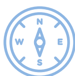
Páginas de ética y cumplimiento en Pulse